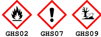
GHS02 GHS07 GHS09